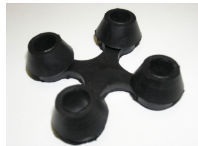
Verbindingsstuk, voor koppelen matten